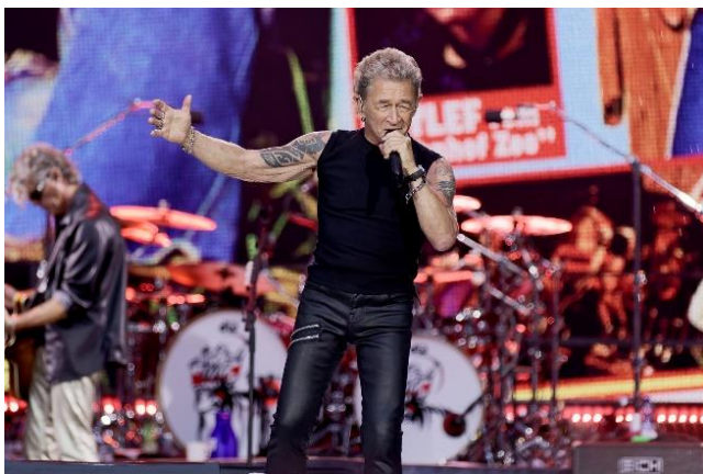
Peter Maffay auf der „We love Rock'n'Roll“ Farewell-Tour

Wedemark, 8. Oktober 2024 – Mit der „We love Rock'n'Roll“ Farewell-Tour füllten Peter Maffay und Band im Sommer 2024 Deutschlands größte Open-Air-Arenen. Digitale und analoge Sennheiser-Drahtlossysteme trugen bei den Auftritten zu einem hervorragenden Sound bei. Neben Sennheiser Digital 6000 Systemen und anderen bewährten Wireless-Lösungen kamen während der Shows auch Komponenten aus der neuen Sennheiser-Serie EW-DX zum Einsatz, darunter brandaktuelle EW-DX EM 4 DANTE Vierkanal-Empfänger.