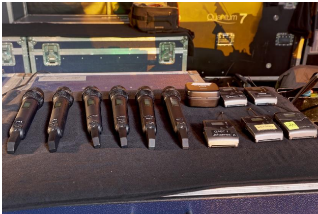
Handsender SKM 6000 ready to go