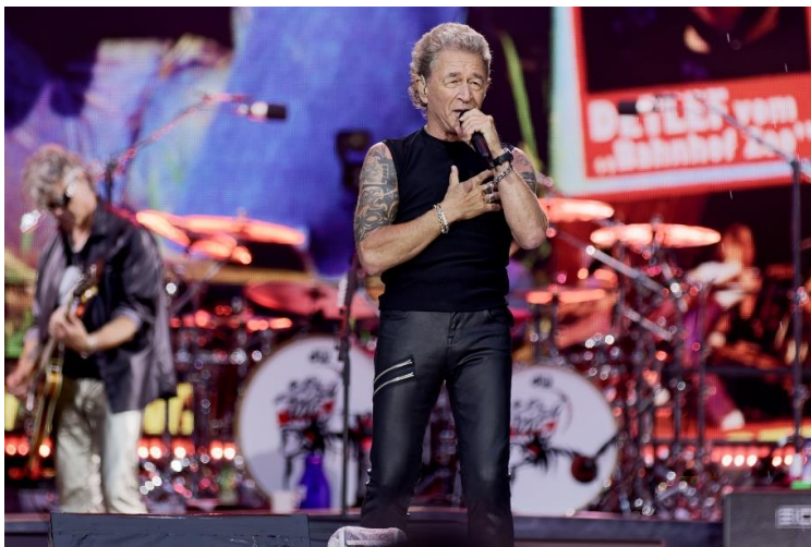
Peter Maffay mit dem Handsender SKM 6000 mit Mikrofonkopf MM 435

Dank einer Schaltbandbreite von bis zu 88 MHz können bei EW-DX bis zu 146 Kanäle im Standardmodus (äquidistanter Frequenzabstand von 600 kHz) und bis zu 293 Kanäle im Link-Density-Modus (LD, mit 300 kHz Abstand) übertragen werden – intermodulationsfrei mit sicherer AES-256-Verschlüsselung. Die Betriebszeit der Akkupacks beträgt zwölf Stunden, mit herkömmlichen AA-Batterien werden bis zu acht Stunden erreicht. Je nach HF-Umgebung erzielen die Sender eine Reichweite von bis zu 100 Metern, was auch für große Bühnen ausreicht.